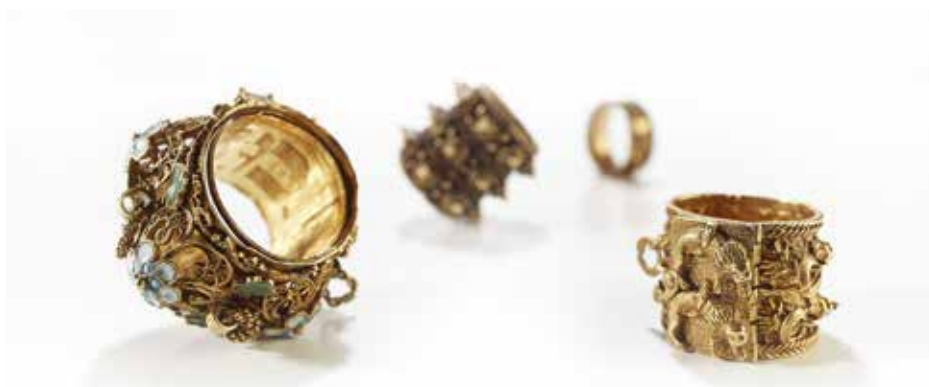
Bagues de mariage, Allemagne et Italie, XVI e -XVII e siècles, or, émail, perles. Dépôt du musée de Cluny - musée national du Moyen Âge, collection Strauss.

Consultez notre programme et organisez votre événement (mahj.org)