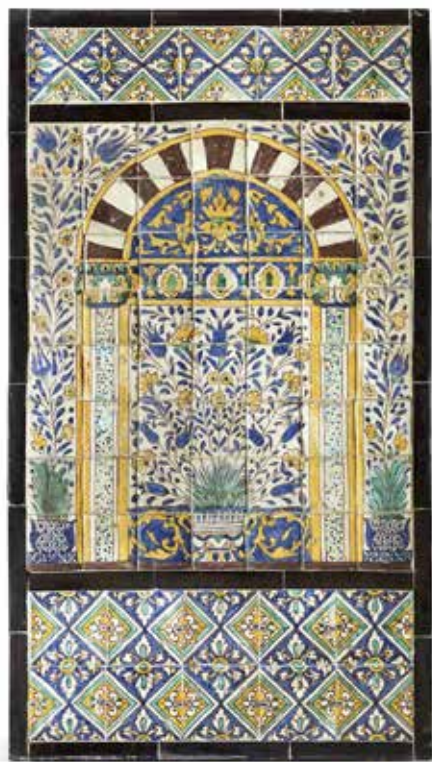
Panneau de revêtement mural, poterie Chemla (vers 1880-1966), Tunis, vers 1920. Céramique polychrome